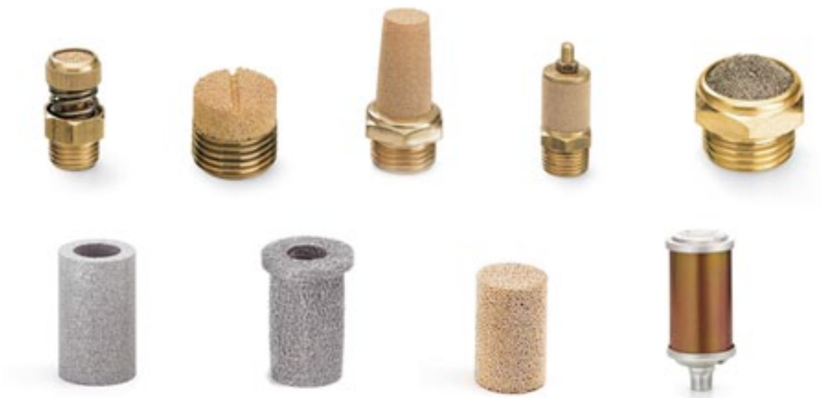
Filtri in acciaio e bronzo Stainless steel and bronze filters Edelstahl un Bronze Filtern